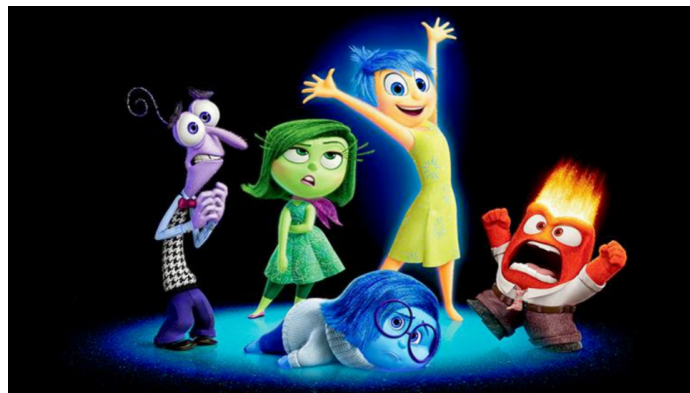
Inside Out, Pixar (2015)

Jest on używany jako technika marketingowa, ale także w fikcji. Pixar, na przykład, jest dobrze znany z używania go w swoich kreskówkach.